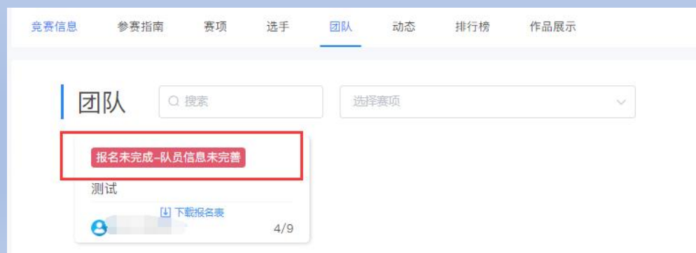
图8 队员信息未完善状态