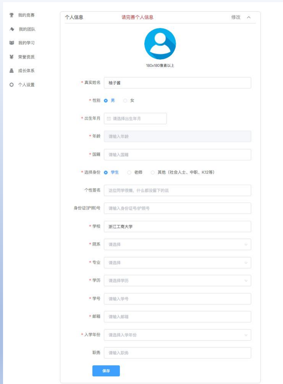
图6 队长完善个人信息页面