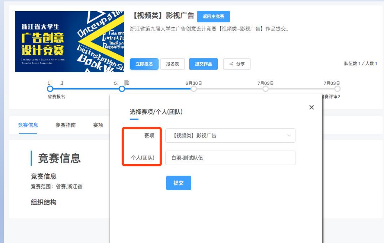
图17 选择赛项和团队