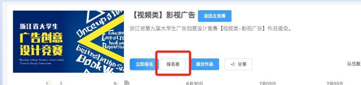
图14 进入报名表页面