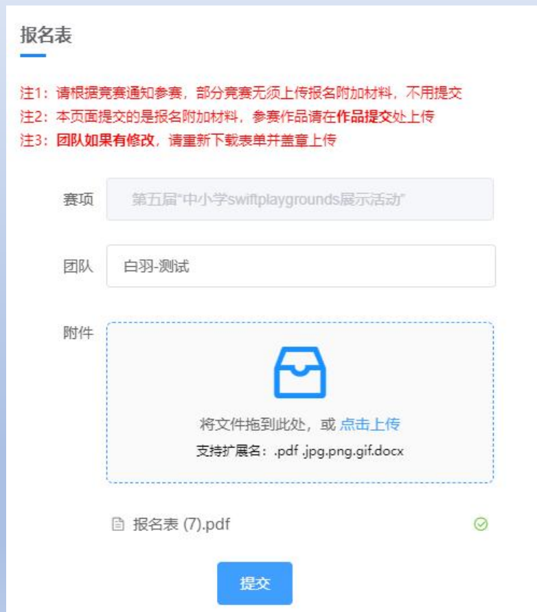
图15 选择相应的赛项及队伍，上传报名表承诺书

专项命题： 在省赛通知附件/省赛平台“大赛动态”页中，下载专项命题参赛报名承诺书空白版，仔细阅读参赛承诺内容，填写报名信息，打印签字后，上传至相应区域。