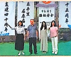
▲屈原故里端午诗社活动现场，诗社社员在吟诵屈原诗歌。